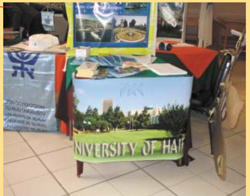
Folleto exhibido en la exposición