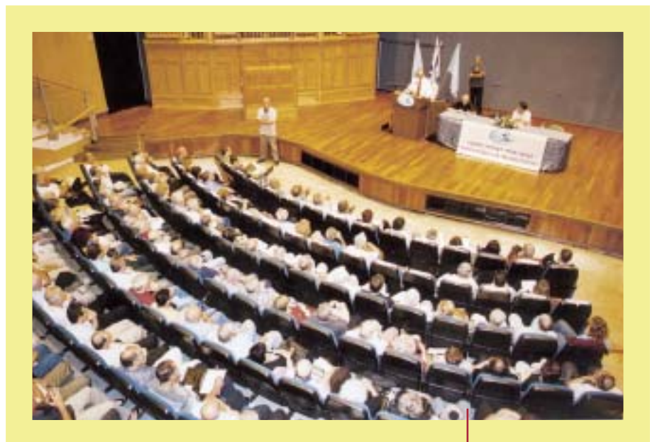
Parte del público presente

Entre sus metas figuran la investigación de alto nivel académico, la conexión de estudios interdisciplinarios sobre los diversos aspectos de la Seguridad Nacional, debate político y asistencia en la formulación de una línea política determinada. La Seguridad Nacional no sólo incluye el aspecto militar sino campos más amplios: político, geográfico, económico, tecnológico. Debido a que cientos de oficiales del Ejército de Defensa de Israel cursan sus estudios en la Universidad de Haifa en el Departamento de Ciencias Políticas estudiando, entre otros, la Ciencias Sociales Modernas y las numerosas opciones del Pensamiento Estratégico; ello ha creado una cálida y activa